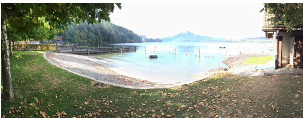
Nur 5 Minuten zur Badi mit Sandstrand