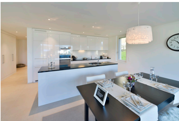
Spielplatz für Hobbyköche