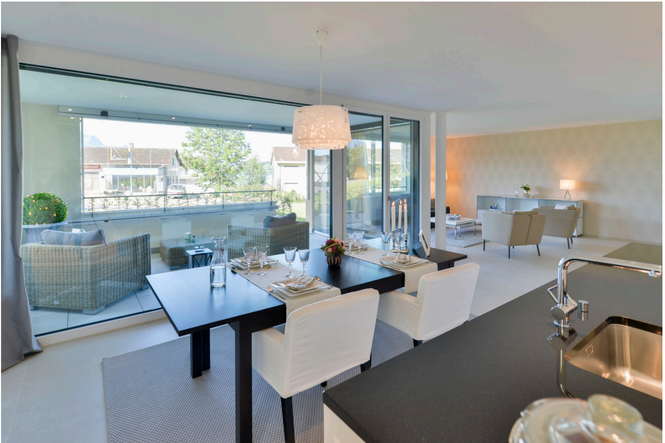
Wohn(t)räume zum Erleben