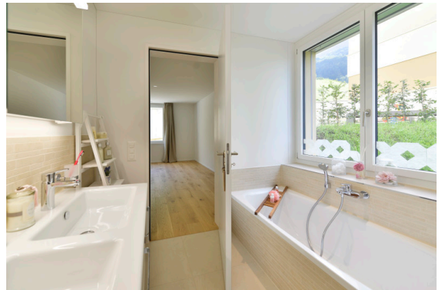
Elternschlafzimmer mit Ensuite-Bad