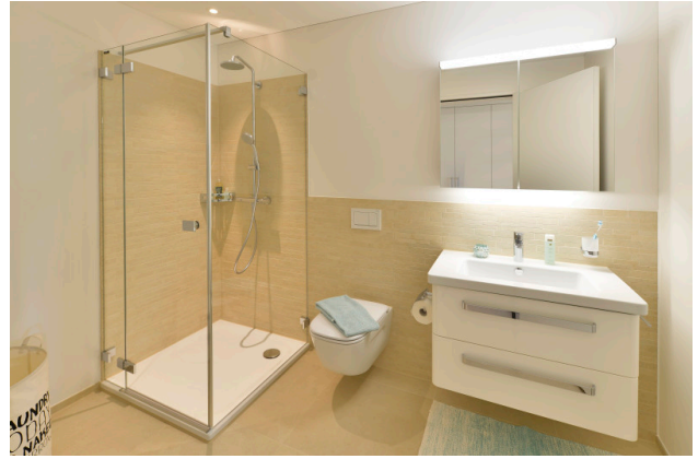
Hier lässt's sich genussvoll duschen