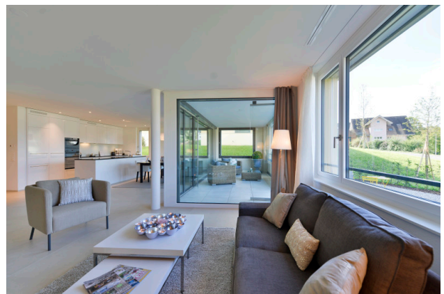
Geschmackvoll ausgebaute Wohnungen, welche kaum Wünsche offen lassen