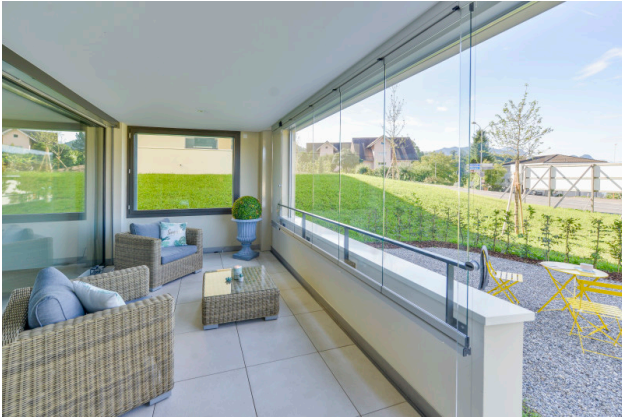
Geniessen Sie gemütliche Sonnenstunden auf Ihrer Loggia oder Gartensitzplatz