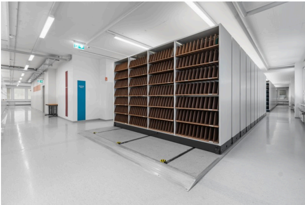
Ausgebaute Gewerbeflächen Objekt 3021