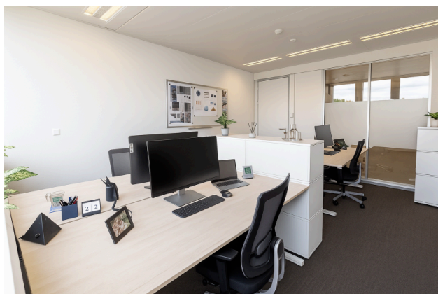
So fühlt sich ein lebendiger Arbeitsplatz an – modern, einladend, inspirierend.