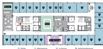
Übersichtsplan - 26 Offices / 2 Meetingräume / 12 Co-Working Arbeitsplätze / ästhetische Gemeinschaftsräume