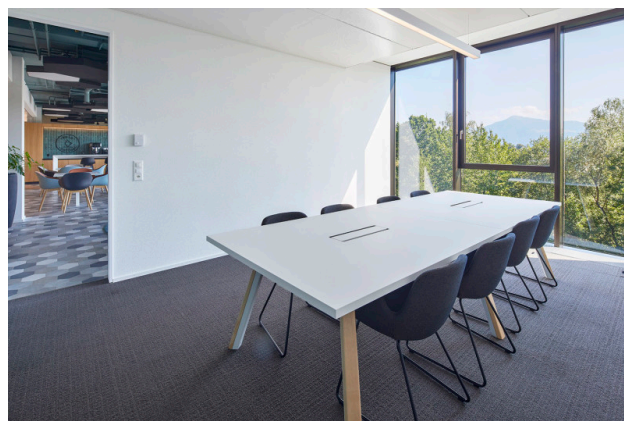
Buchbarer Meetingraum mit modernster Ausstattung, zeitgemässe Technik und Panoramaaussicht.