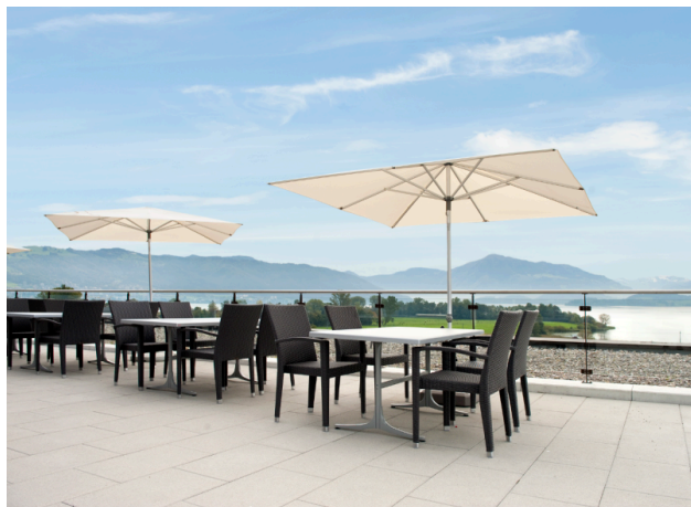
Seesicht und Sonne – Die ideale Terrasse für ein entspanntes Mittagessen