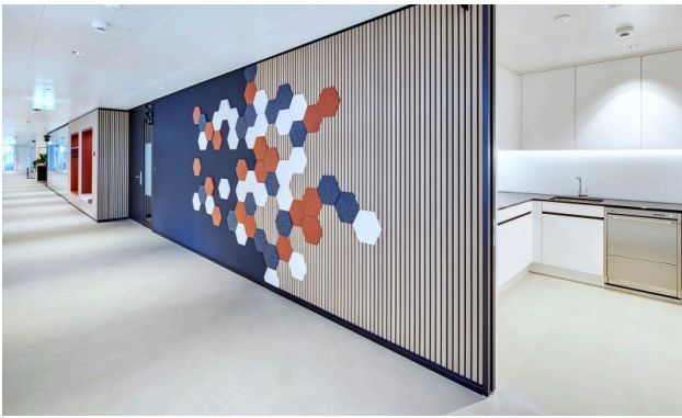
Korridor / Küche