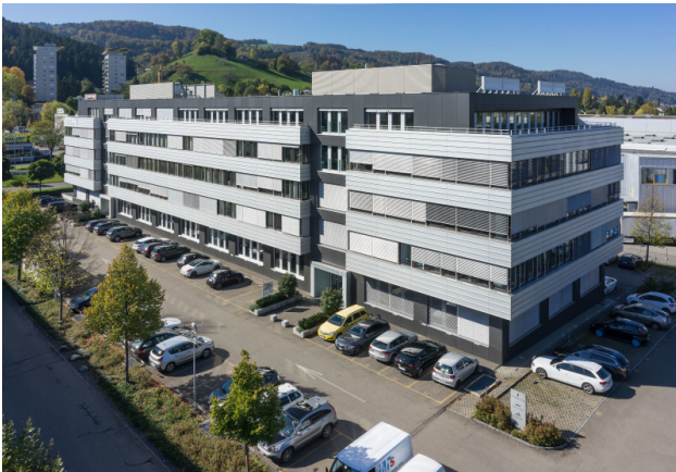
Ihr repräsentativer Firmensitz