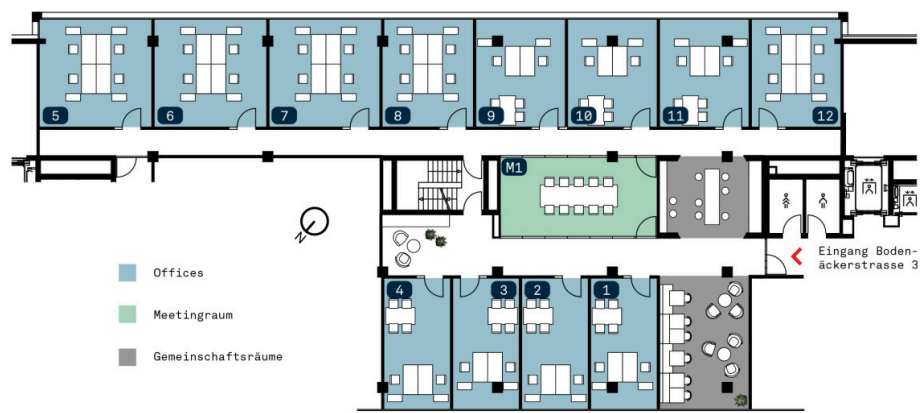
Übersichtsplan - 12 Offices / 1 Meetingraum / ästhetische Gemeinschaftsräume