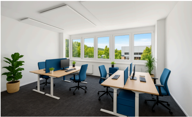
Gestalten Sie den Raum für Ihr Team – ganz nach Ihren Vorstellungen