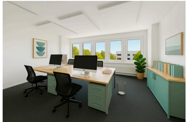
Unmöbliert, aber voller Möglichkeiten – Inspiration des 36 m 2 Büros durch Virtual Staging