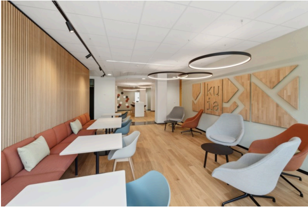
Einladende Gemeinschaftslounge, welche sich direkt neben dem Coffee Corner befindet