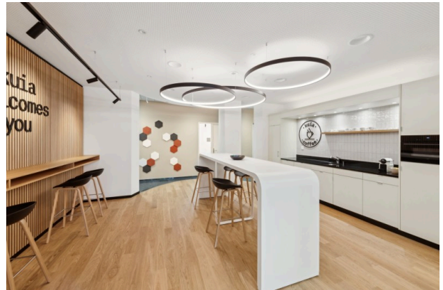
Der Coffee Corner ist der Treffpunkt im kuia-office