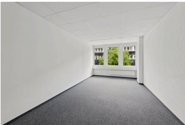
Musterbeispiel Office (27 m 2 ) – unmöbliert, bereit für Ihre Vision