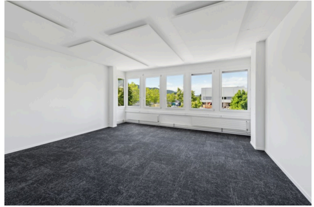
Musterbeispiel Office (36 m 2 ) – Ihre leere Leinwand für neue Ideen