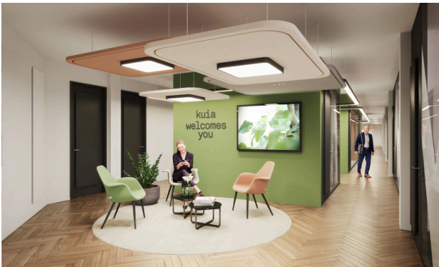
Un espace d'accueil chaleureux – parce que la première impression compte