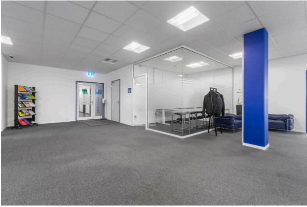
Eingangsbereich mit Sitzungszimmer Objekt 3022