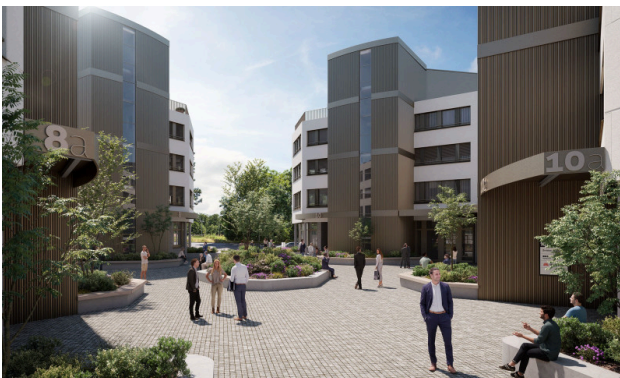
Begrünter Innenhof - ein Ort zum Durchatmen und Verweilen