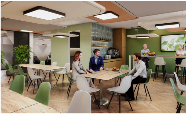
Der Coffee Corner - der Treffpunkt im kuia-office