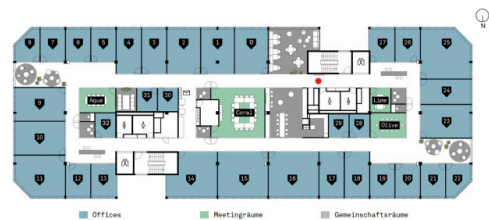
Übersichtslegende - 33 Offices / 4 Meetingräume / ästhetische Gemeinschaftsräume