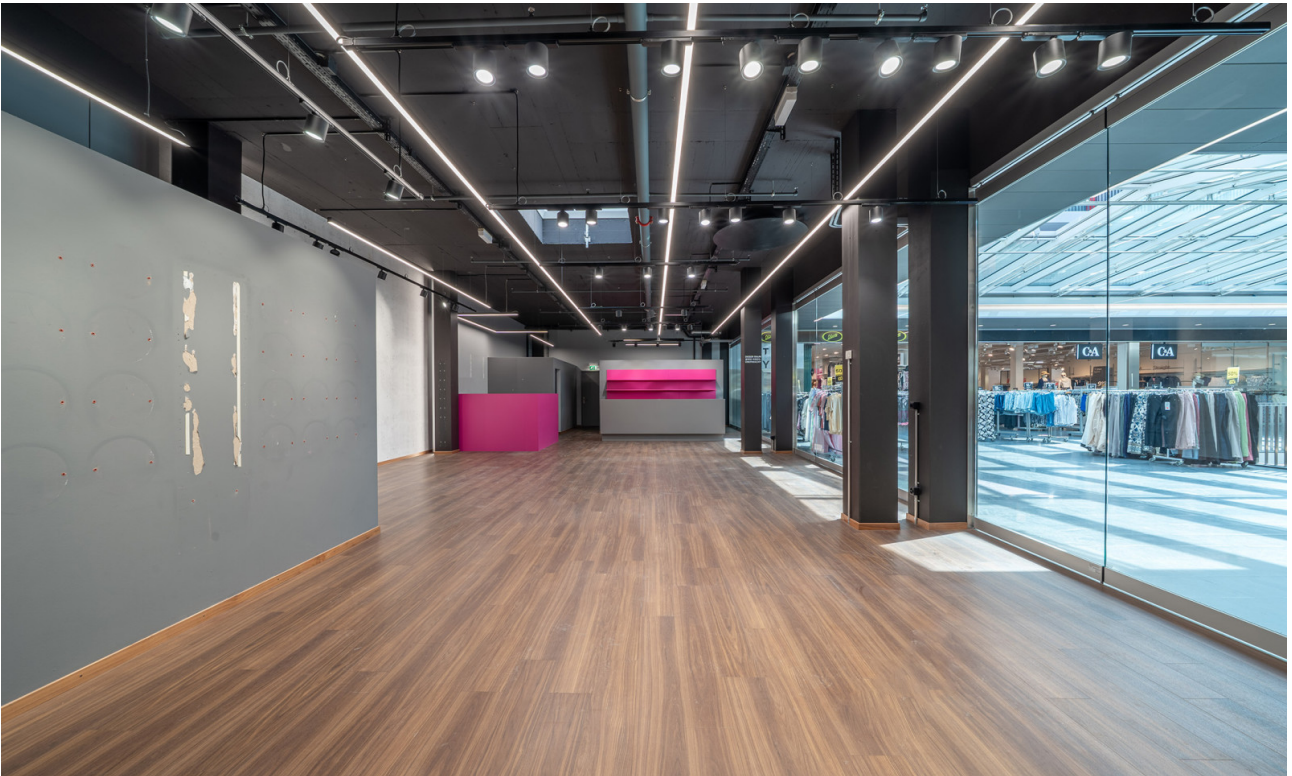
Bestehender Innenausbau - Ladenfläche