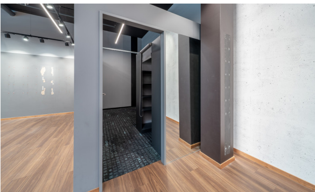
Bestehender Innenausbau - Backoffice