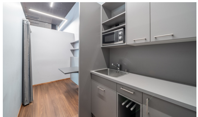
Bestehender Innenausbau - Backoffice