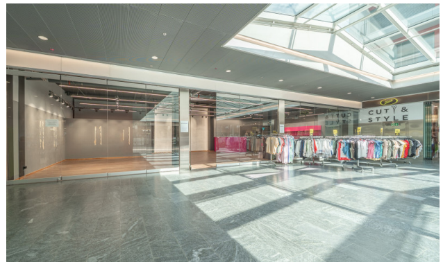
Ansicht aus der Mall