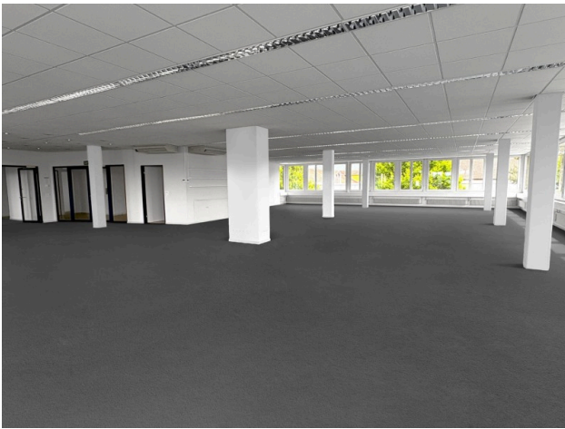
Eingangsbereich und offener Bürobereich