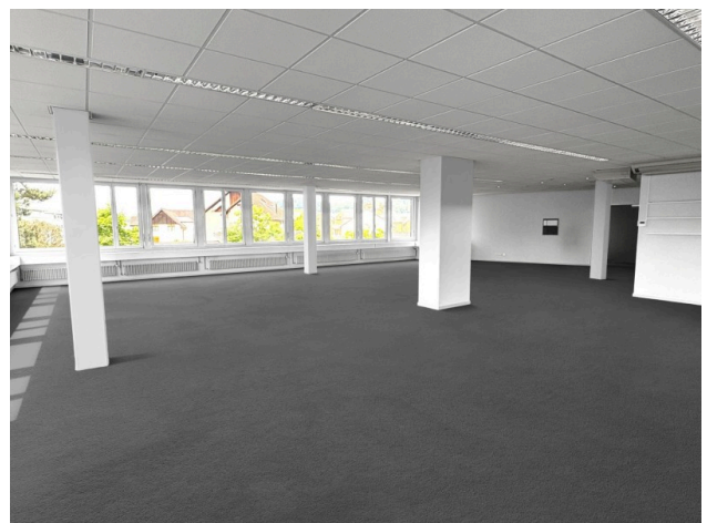
Bürobereich Richtung Eingang