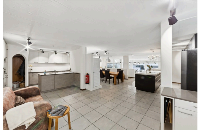
Viel Raum im Zwischengeschoss