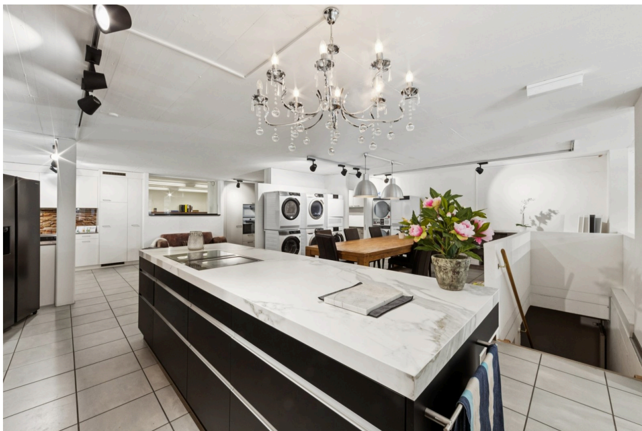
Showroom im Zwischengeschoss