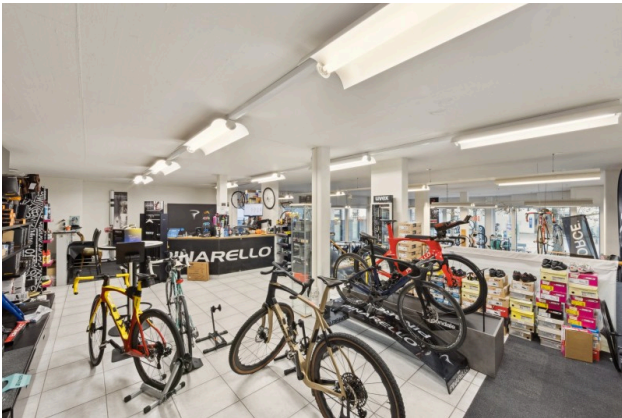
Flexibel für jegliche Nutzungen