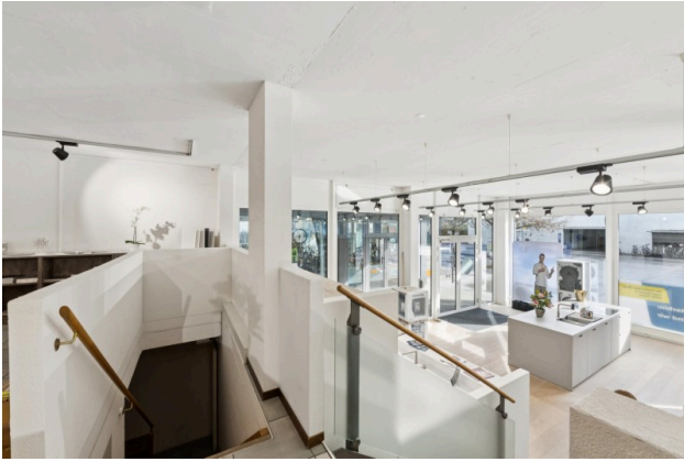
Zwischengeschoss mit Treppen zu Lager und Erdgeschoss