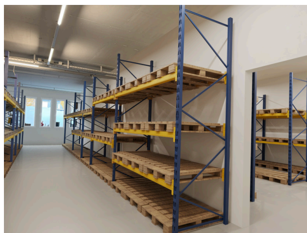
Option 2 mit Lagergestellen