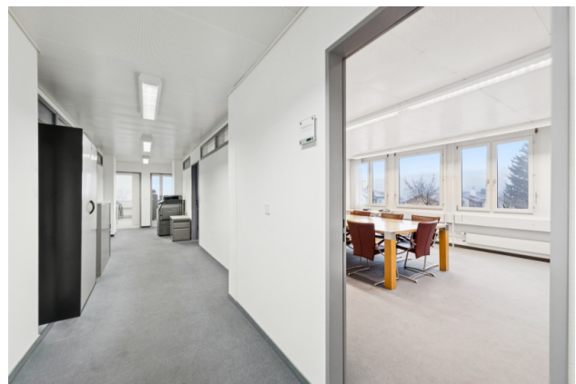
Korridor mit Blick ins Sitzungszimmer