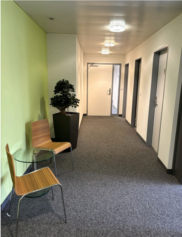
Vorraum im Treppenhaus