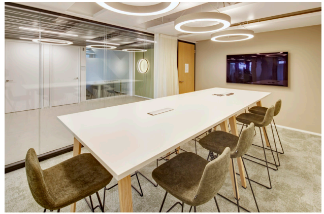
Vier Meetingräume im kuia-office - flexibel und stündlich buchbar