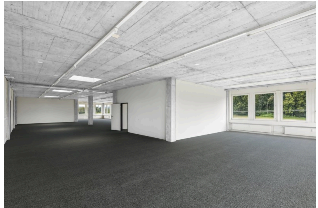
Offener Bürobereich (Visualisierung Teppichboden)