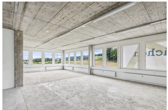
Halboffenes Eckbüro mit Blick ins Grüne