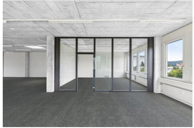
Sitzungszimmer / Einzelbüro (Visualisierung Teppichboden)