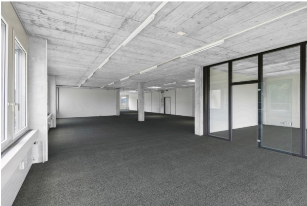
Offener Bürobereich mit Zugang zum Sitzungszimmer (Visualisierung Teppichboden)