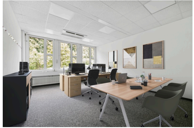
Büro 4 - virtuell möbliert