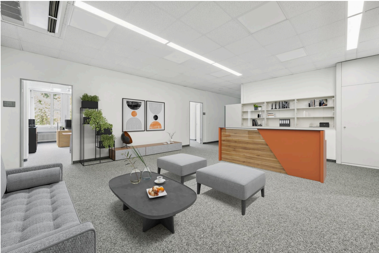
Empfangs- und Ausstellungsbereich - virtuell möbliert