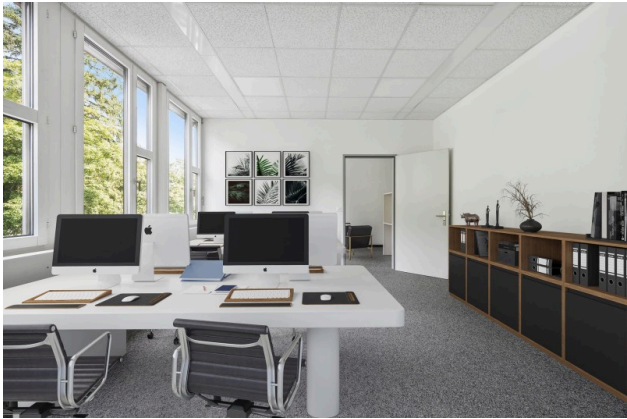
Büro 2 - virtuell möbliert