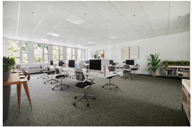
Grossraumbüro - virtuell möbliert