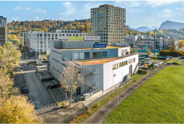
Aussenansicht / Parkplätze im Freien