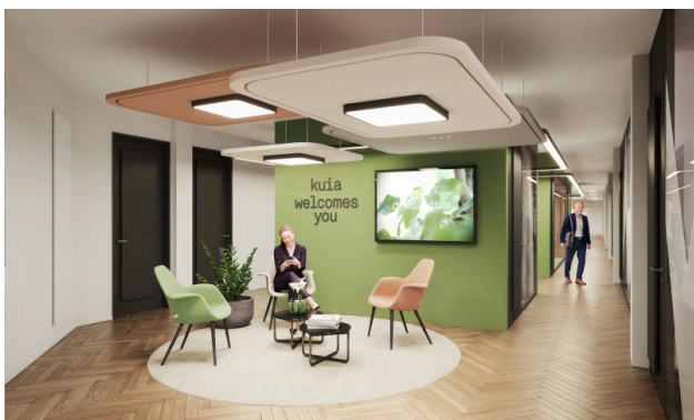
Un espace d'accueil chaleureux – parce que la première impression compte