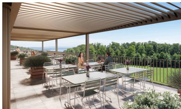
Vue sur le lac et bain de soleil – la terrasse parfaite pour savourer un déjeuner paisible