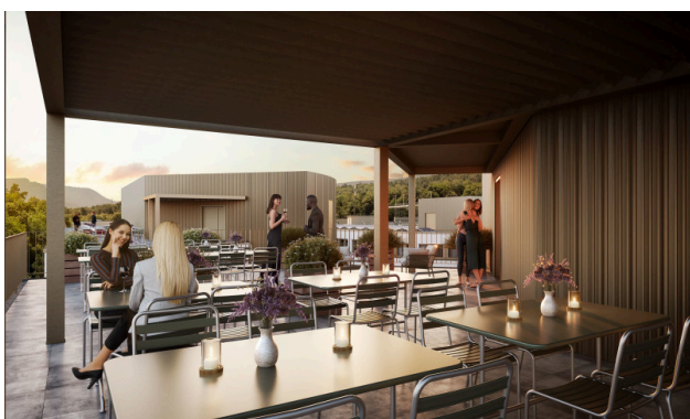
Moments après le travail – l'apéritif parfait au-dessus des toits de la ville