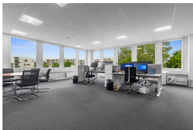
Offener Arbeitsbereich mit guter Belichtung