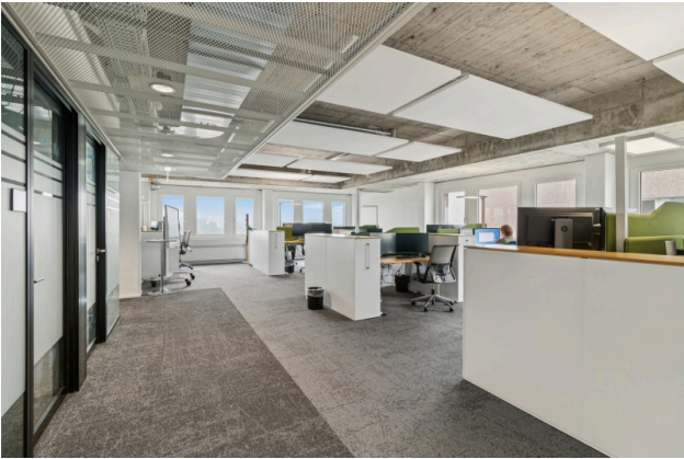
Moderner Open Space