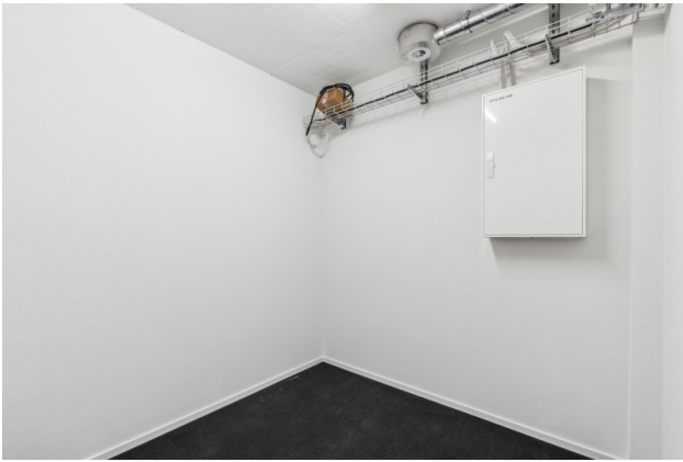
Archiv / Netzwerkraum