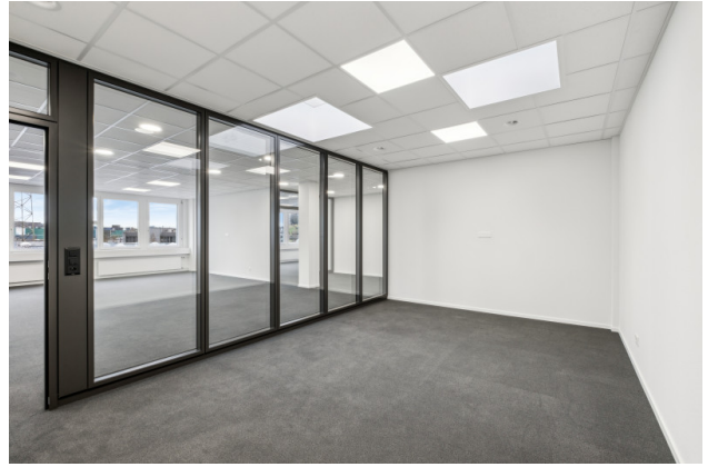
Sitzungszimmer mit Dachluke