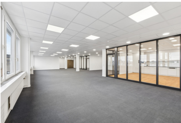
Büro Openspace / Küche