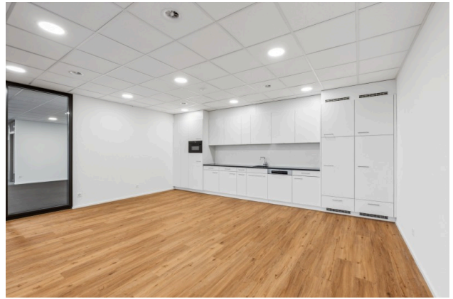
Küche / Aufenthaltsraum