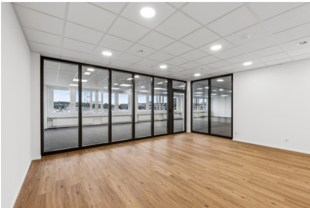
Küche / Aufenthaltsraum