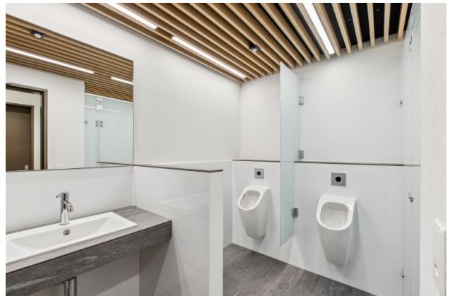
Moderne Toiletten (M/F) auf der Etage