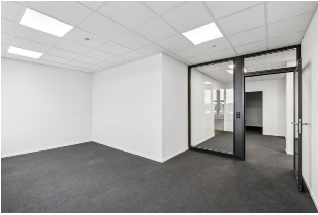
Einzelbüro mit Glasabschluss