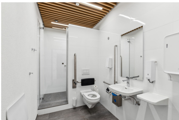
Sportlerdusche zur Mitbenutzung