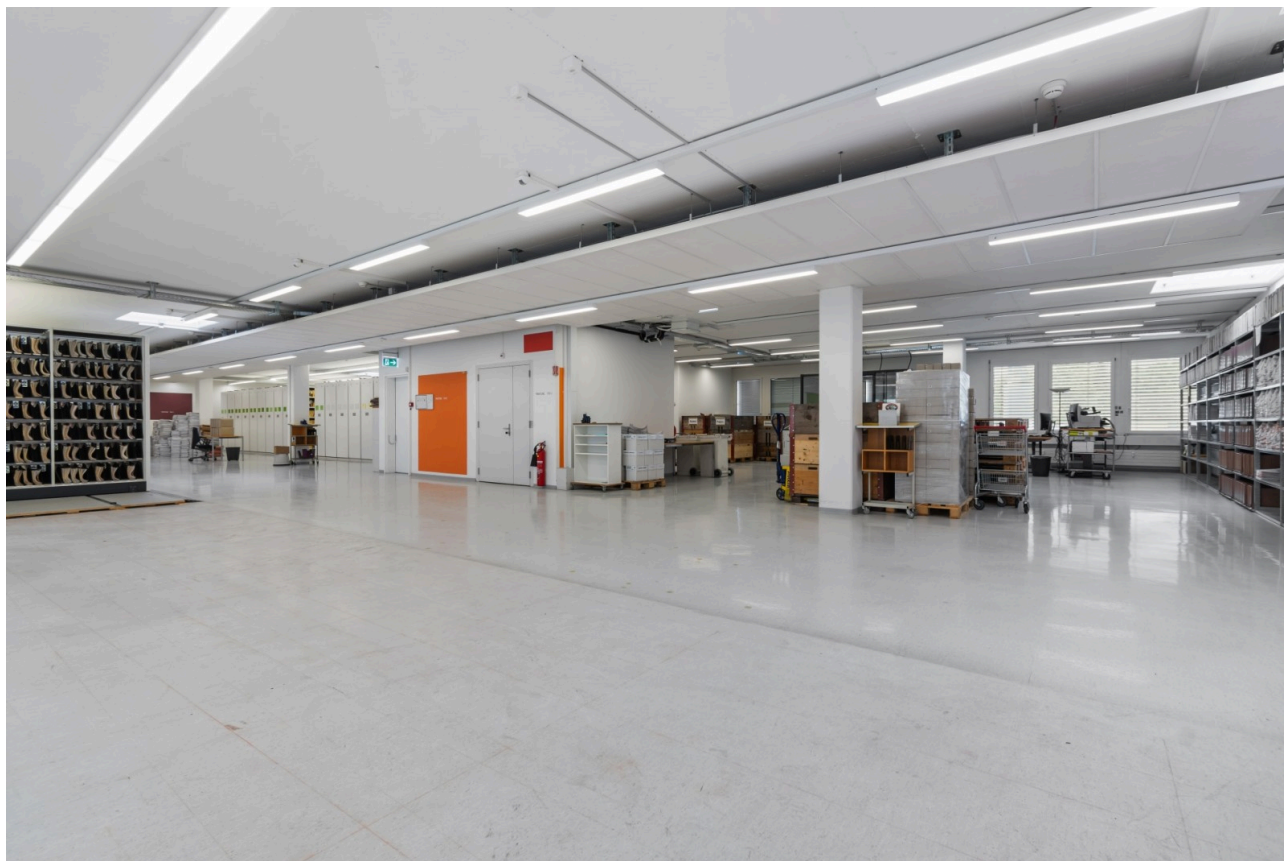
Ausgebaute Gewerbeflächen Objekt 3021