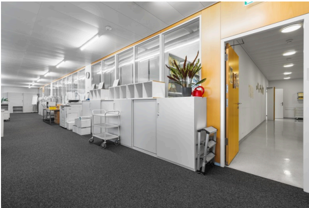
Verbindung Büro zu Gewerbe Objekt 3021