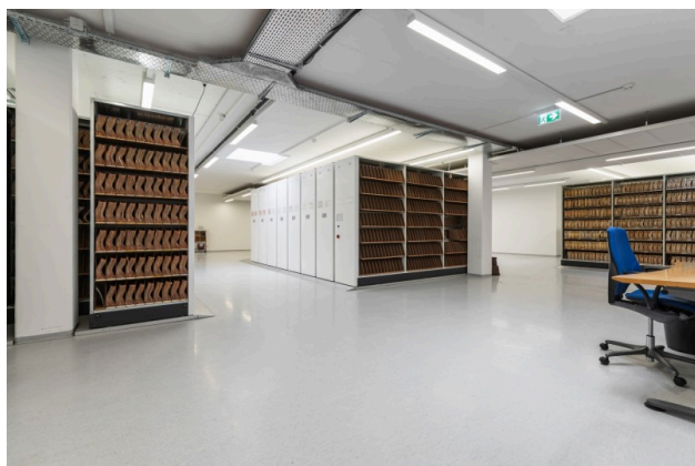
Ausgebaute Gewerbeflächen Objekt 3021