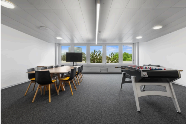
Aufenthaltsraum Objekt 3021