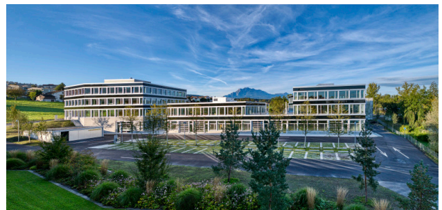
Rückseite der Gebäude 1, 3, 5 mit Pilatusblick