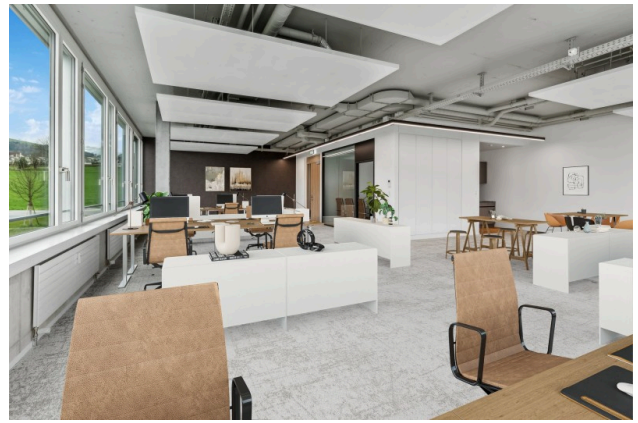
Virtual Staging Büro 1.4.1