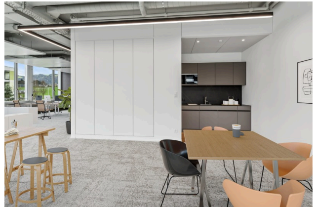
Virtual Staging Büro 1.4.1