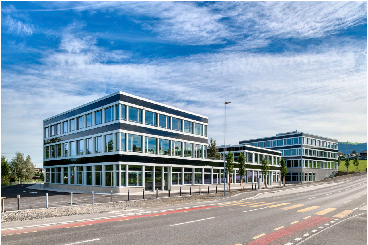
Kreuzung Dorf-, Hauptstrasse in Richtung Dorfzentrum Buchrain