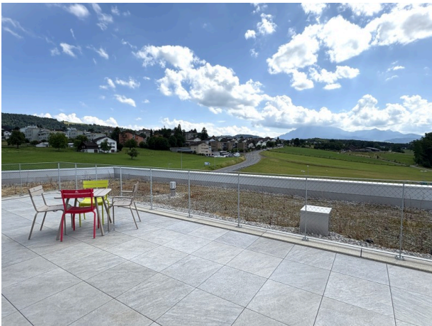
Dachterasse zur Mitbenützung mit besten Aussichten