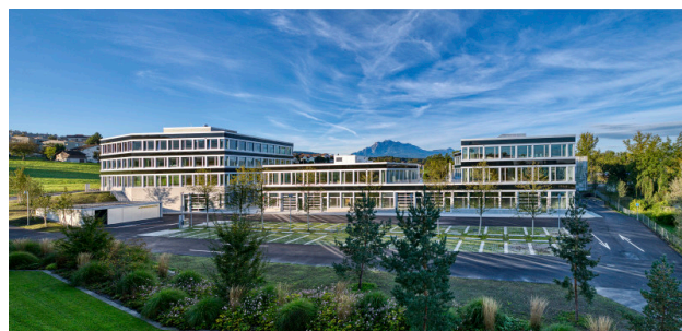
Rückseite der Gebäude 1, 3, 5 mit Pilatusblick