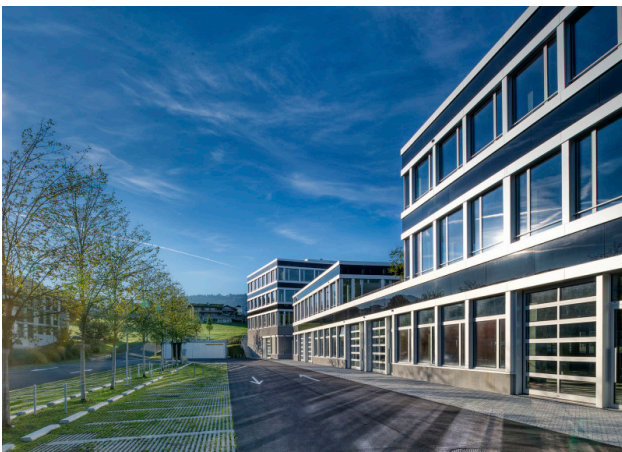
Hochwertige Glas-, Metallfassade