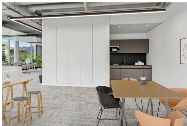
Virtual Staging Büro 1.4.1