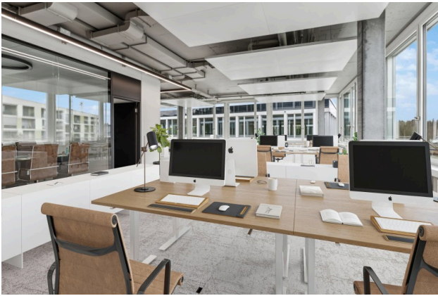
Virtual Staging Büro 1.4.1