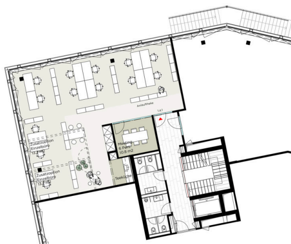
Layout- Ausführungsplan 1.4.1