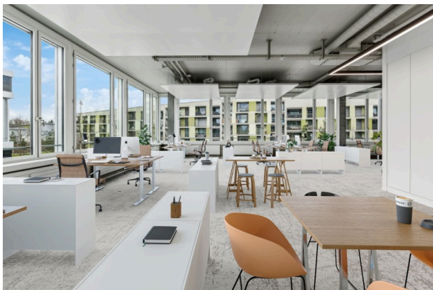
Virtual Staging Büro 1.4.1