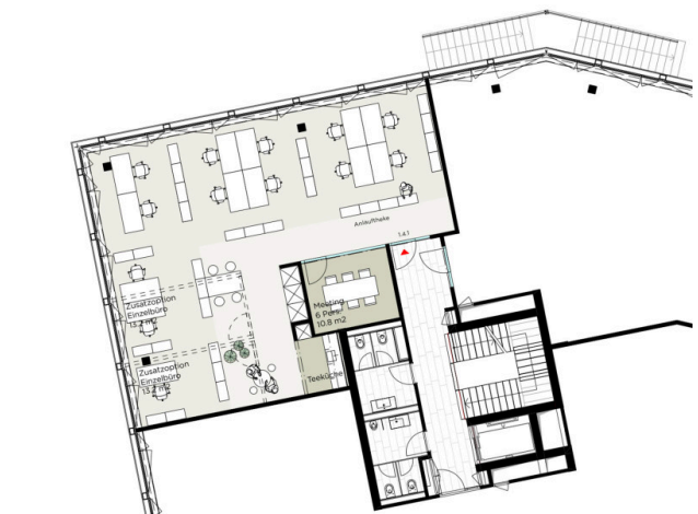
Layout- Ausführungsplan 1.4.1