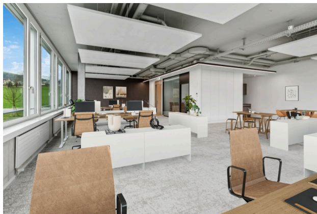
Virtual Staging Büro 1.4.1