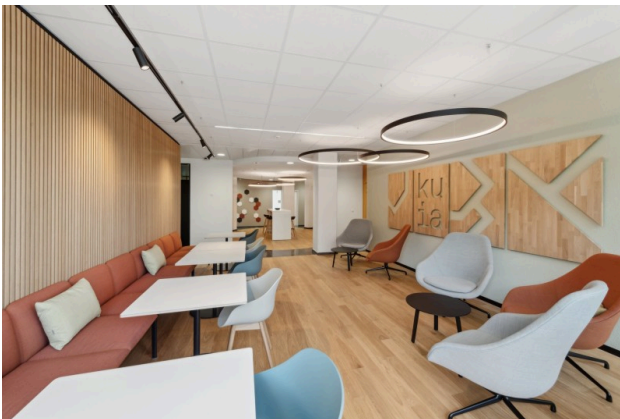
Einladende Gemeinschaftslounge, welche sich direkt neben dem Coffee Corner befindet