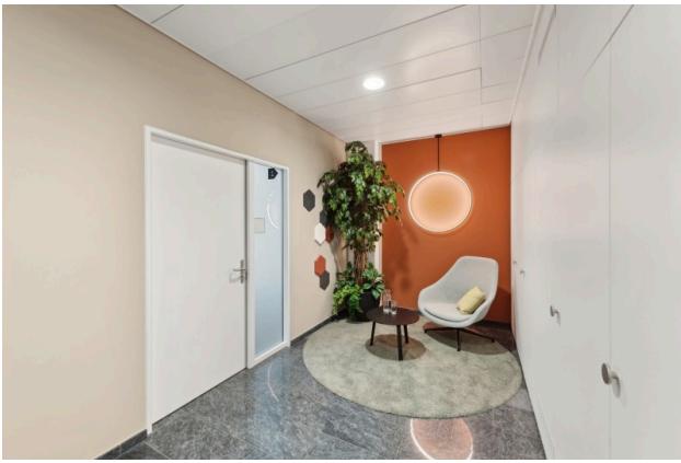
Entspannen – In stilvoller Atmosphäre mit einem Hauch Natur