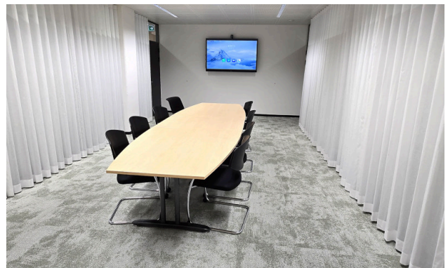
Meetingraum "Limmat" – garantiert ein ideales Setup für gemeinsame Besprechungen