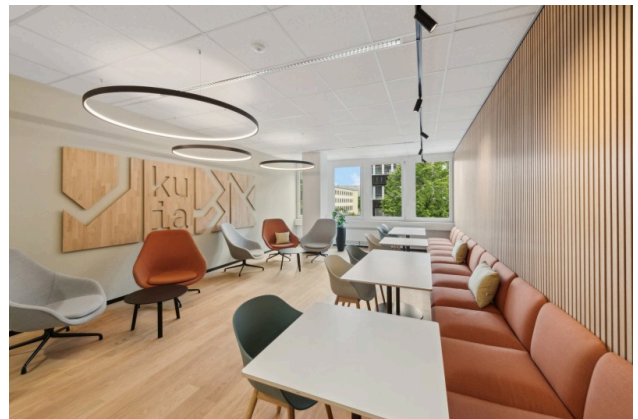
Ein Ort zum Abschalten, Auftanken und Zusammensein