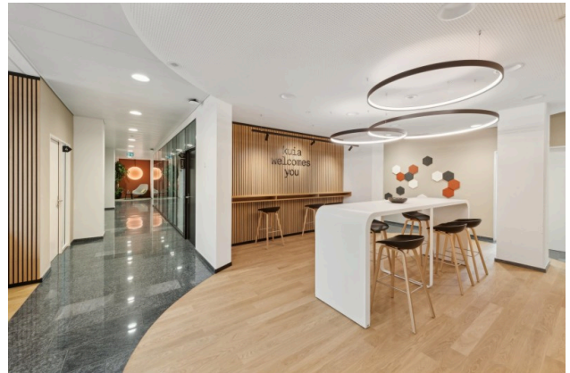
Willkommen mit Stil – Der erste Eindruck zählt