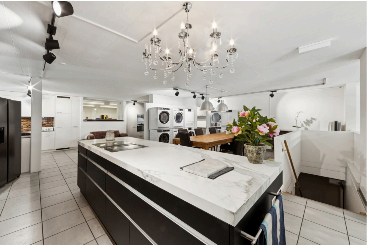
Showroom im Zwischengeschoss