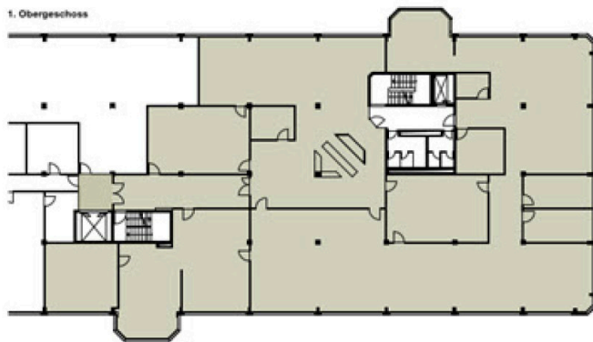
Sennweidstrasse 47/49 Grundrisse 1.OG + 2.OG