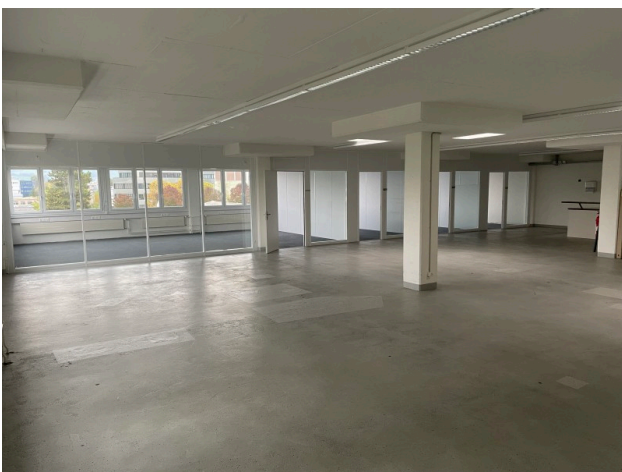
Ansicht Bürofläche mit Glaswänden