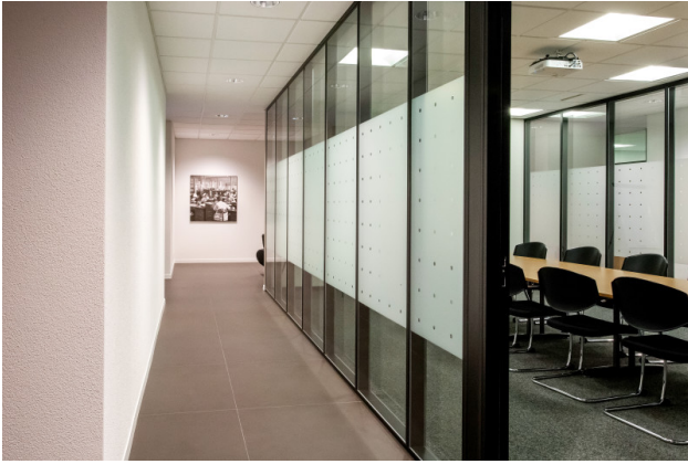
Sitzungszimmer zur Mitbenutzung