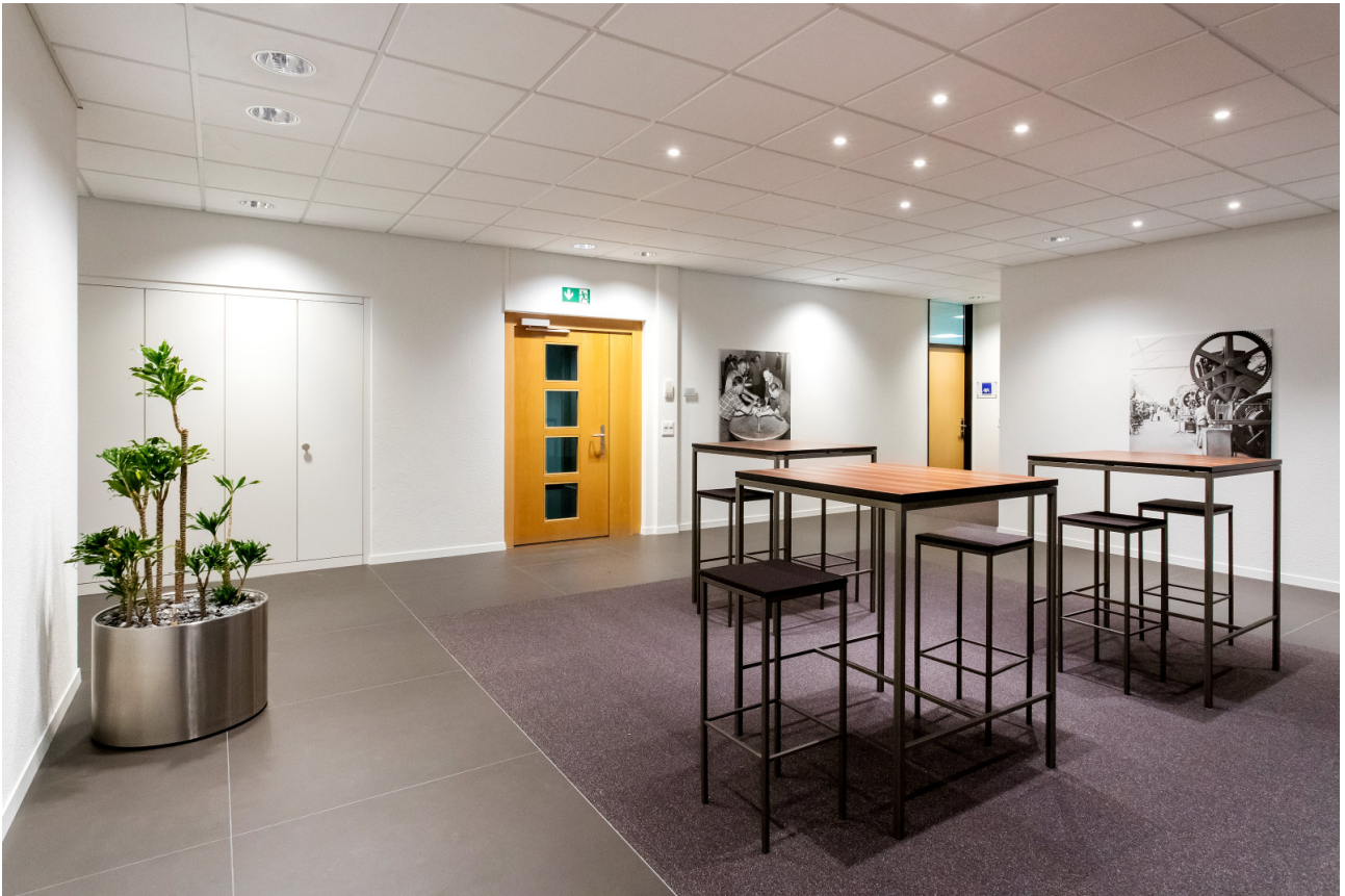
Bistrotische und Hocker zur Mitbenutzung