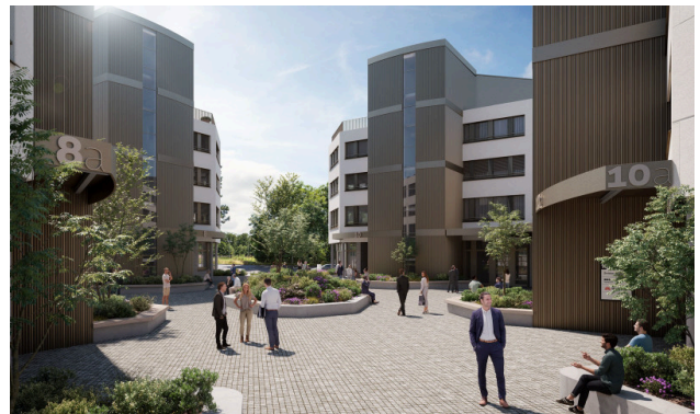
Cour intérieure végétalisée – un havre de calme et de bien-être