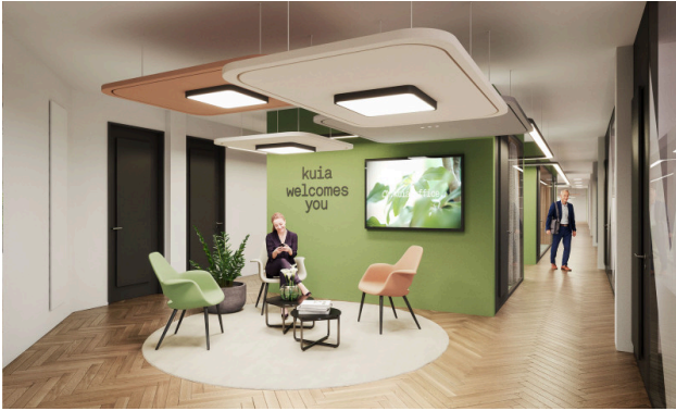
Un espace d'accueil chaleureux – parce que la première impression compte