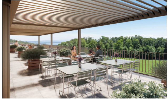
Vue sur le lac et bain de soleil – la terrasse parfaite pour savourer un déjeuner paisible