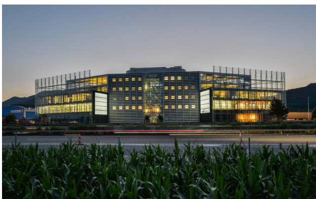
Frontansicht mit Belichtung