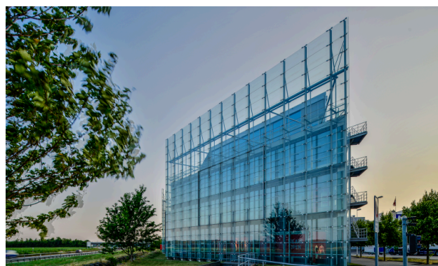
Aussenansicht Richtung Bern