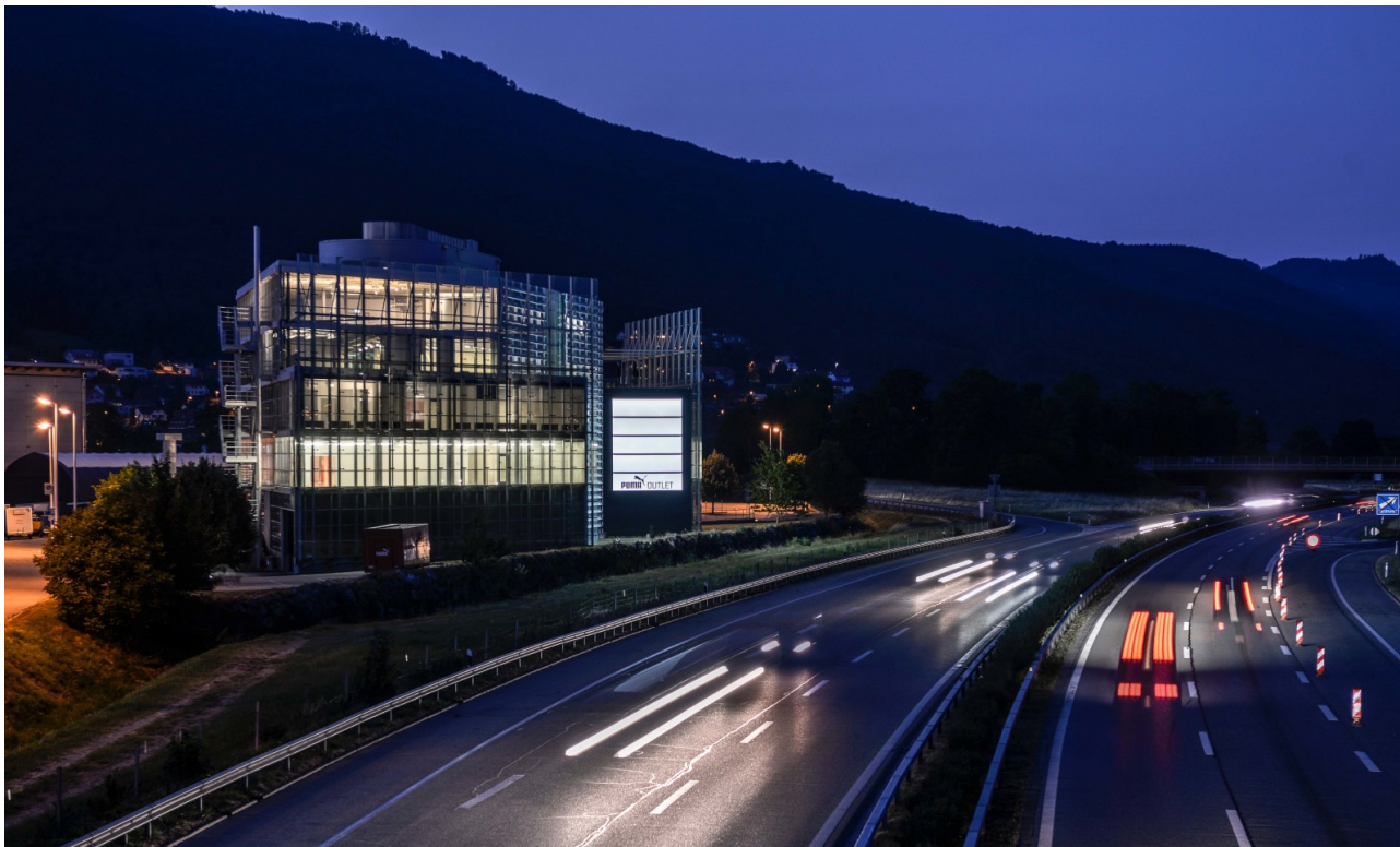
Beleuchtete Werbeträger - gute Sichtbarkeit