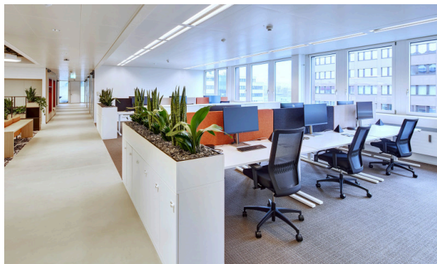
12 Co-Working Arbeitsplätze - tageweise buchbar