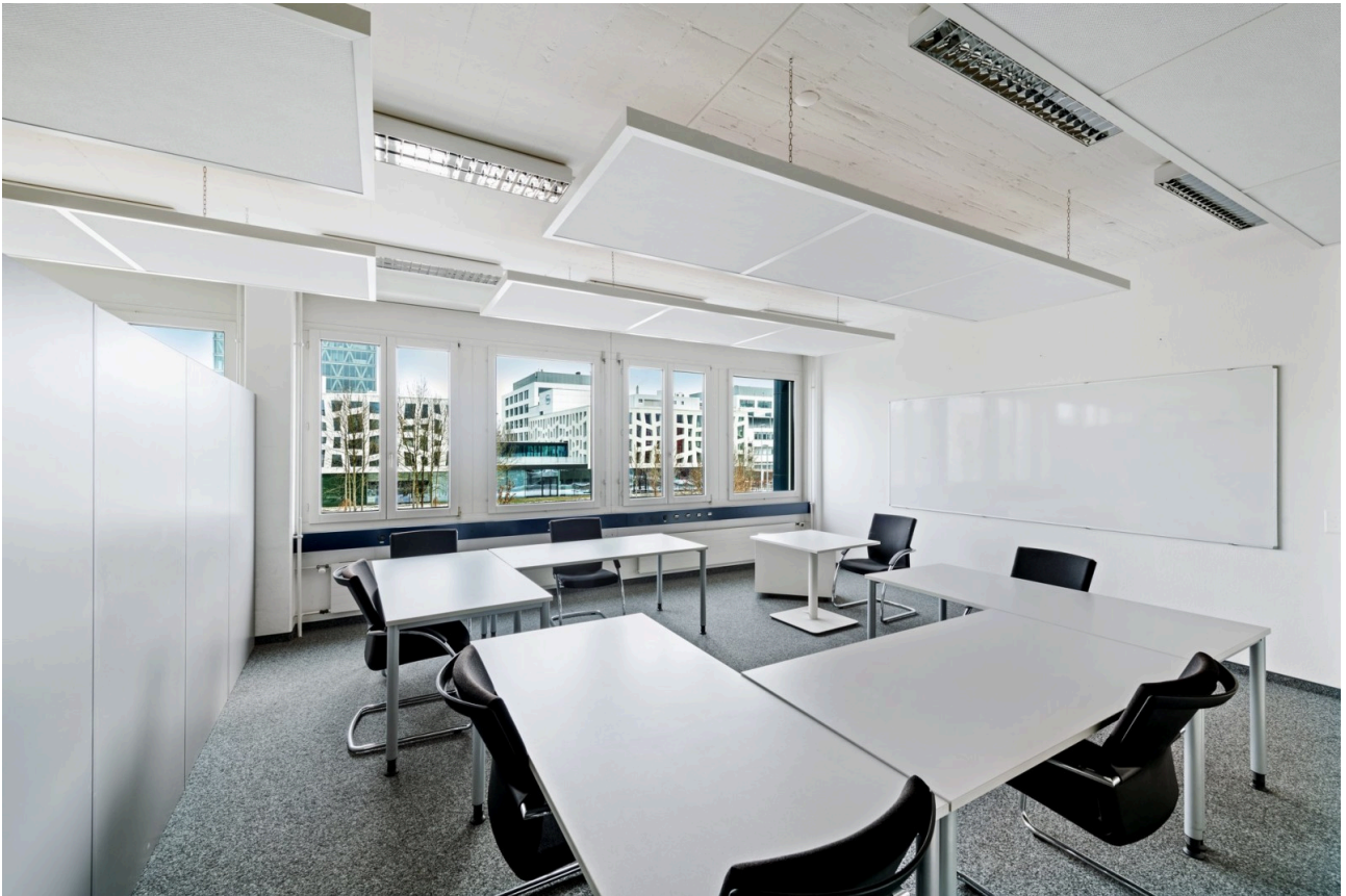
Büro Blickrichtung Südwest