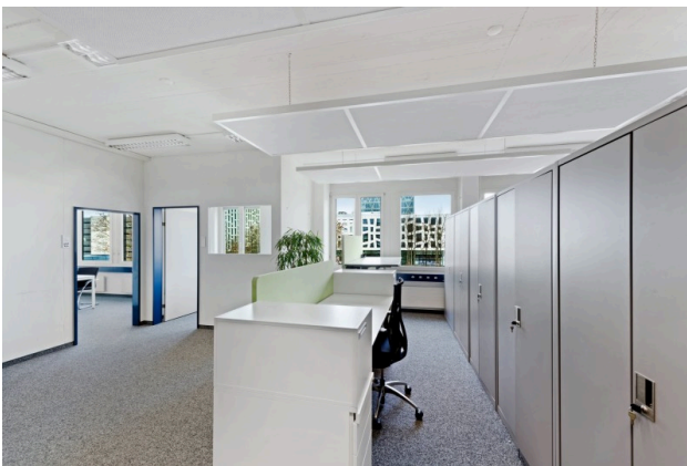
Büro Blickrichtung Südost