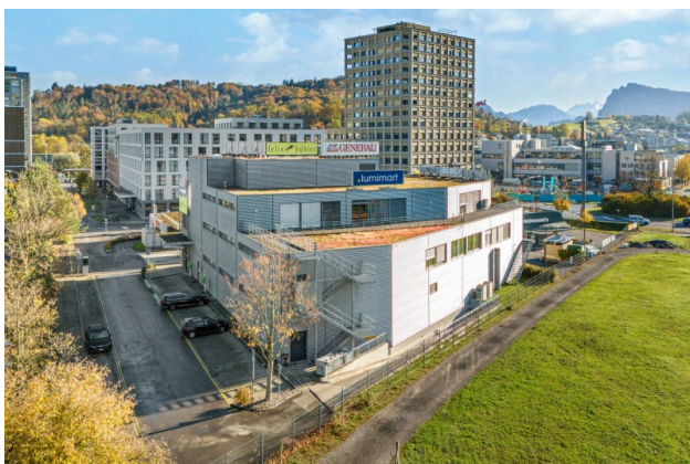
Aussenansicht / Parkplätze im Freien