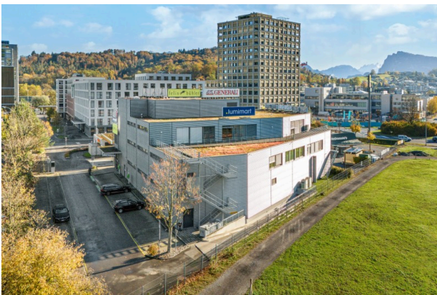
Aussenansicht / Parkplätze im Freien