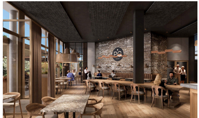
Restaurant au rez-de-chaussée – élégance à l'intérieur, charme sur la terrasse extérieure