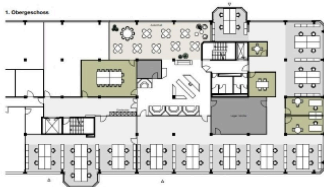
Sennweidstrasse 47/49 Grundrisse 1.OG + 2.OG Nutzungsstudie