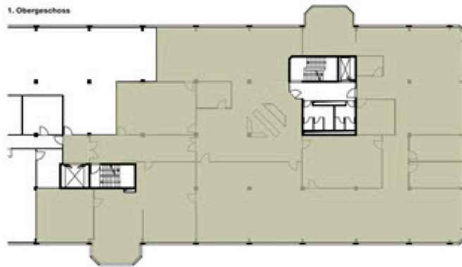
Sennweidstrasse 47/49 Grundrisse 1.OG + 2.OG