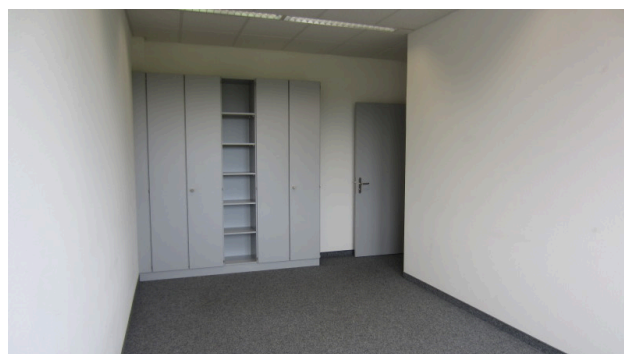
viele Einbauschränke vorhanden