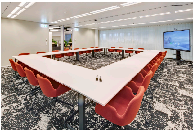
Der Konferenzraum garantiert ein ideales Setup für grössere Besprechungen.