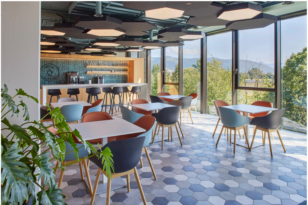
Treffpunkt für Austausch & Entspannung mit Weitblick