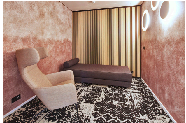
Recharge-Raum – Ihre kurze Auszeit für neue Energie