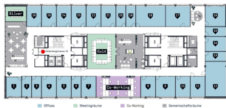
Übersichtsplan - 26 Offices / 2 Meetingräume / 12 Co-Working Arbeitsplätze / ästhetische Gemeinschaftsräume