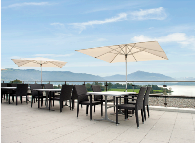
Seesicht und Sonne – Die ideale Terrasse für ein entspanntes Mittagessen