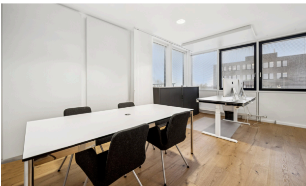
Einzelbüro mit Platz für Besprechungstisch