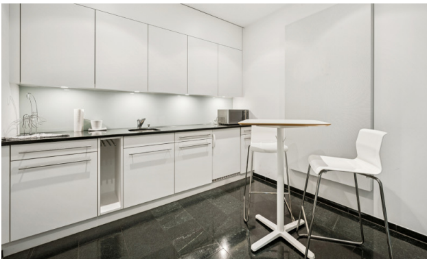
Teeküche mit Kühlschrank