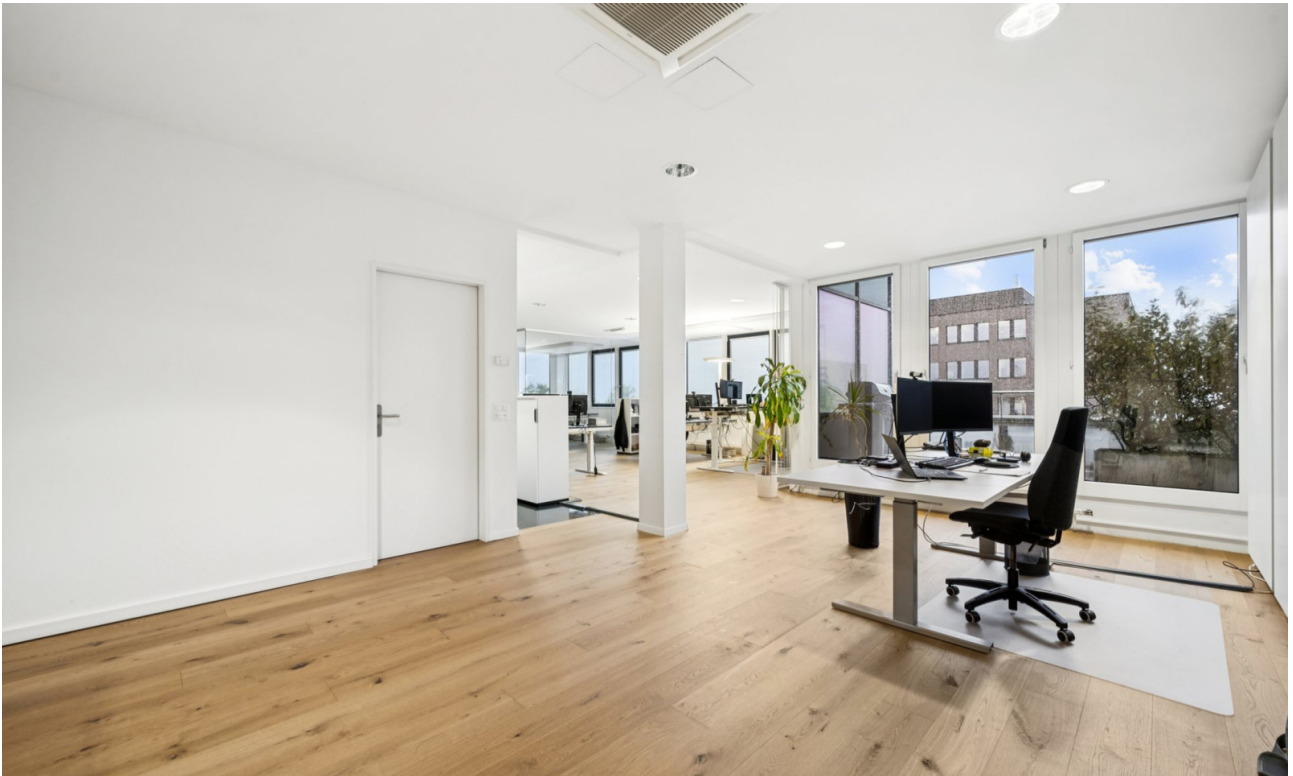
Lichtdurchflutete Büros mit Parkettboden