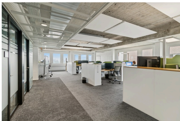
Moderner Open Space