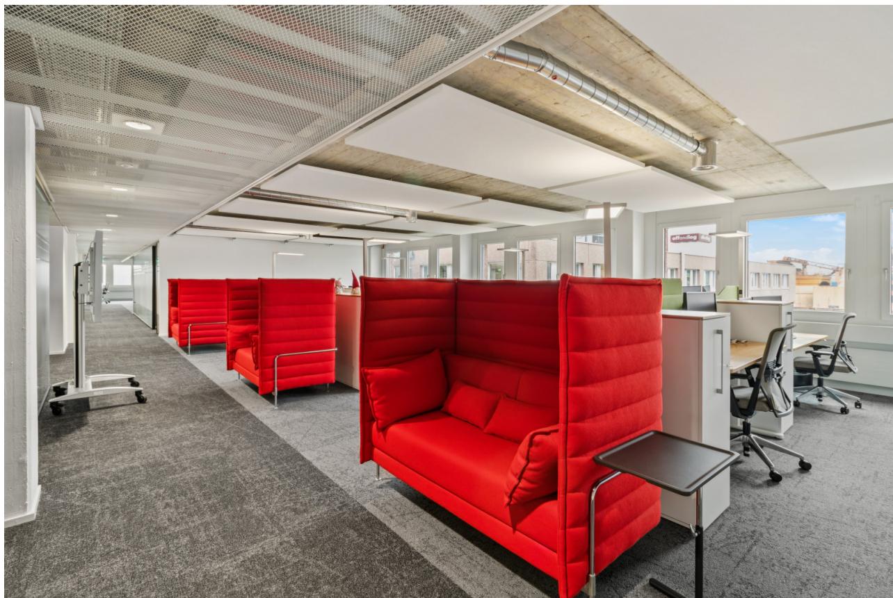
Rückzugsorte für fokussiertes Arbeiten