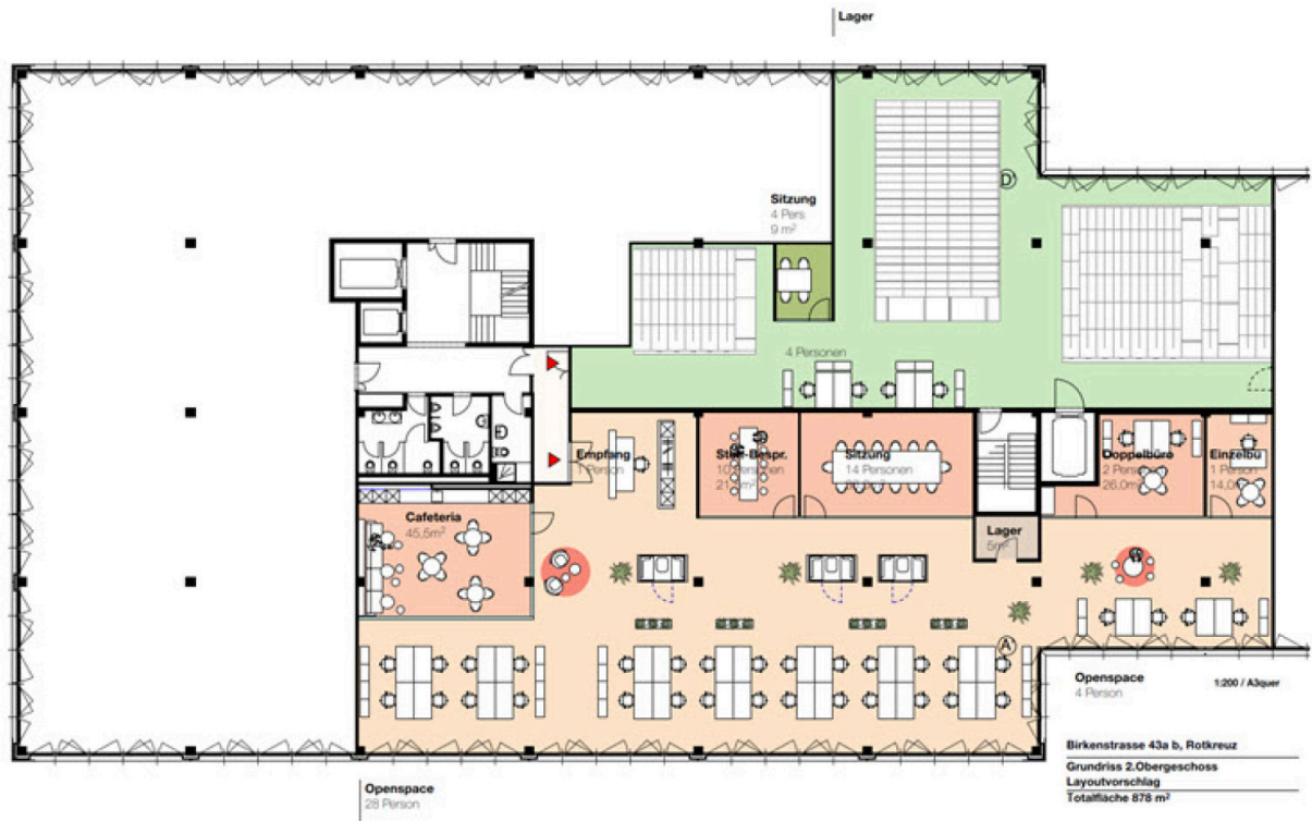
Grundrissplan 2. Obergeschoss Birkenstrasse 43a/b, 6343 Rotkreuz