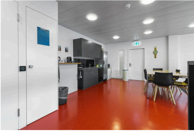
Teeküche in Aufenthaltsraum