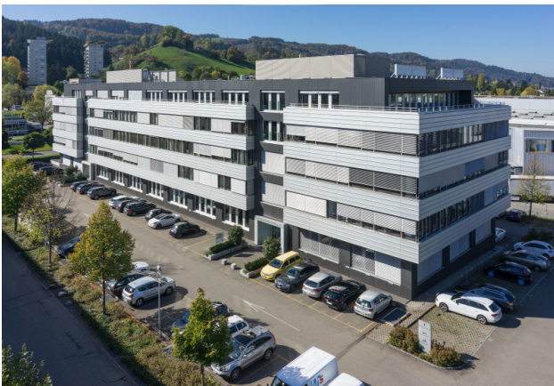
Ihr repräsentativer Firmensitz