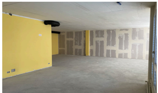
Mietfläche im Grundausbau