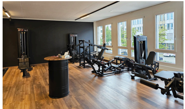
Bestehender Innenausbau kann vom Vormieter übernommen werden