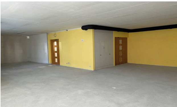
Mietfläche im Grundausbau