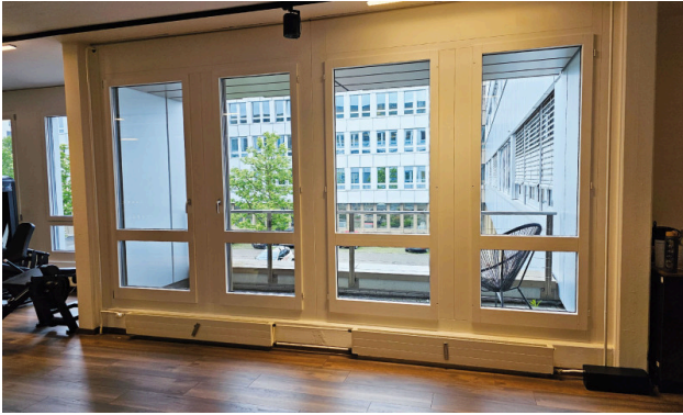
Kleine Loggia zum Innenhof