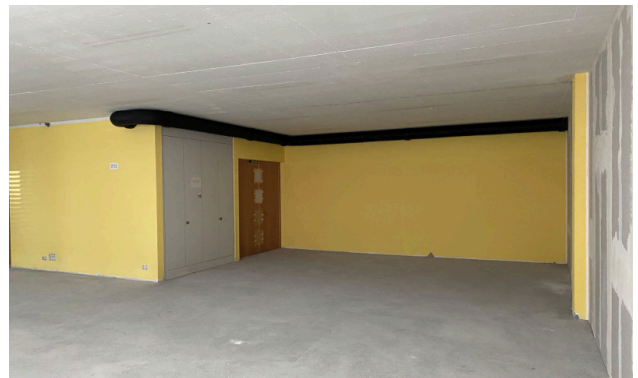
Mietfläche im Grundausbau