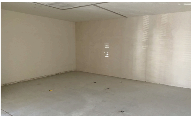
Mietfläche im Grundausbau