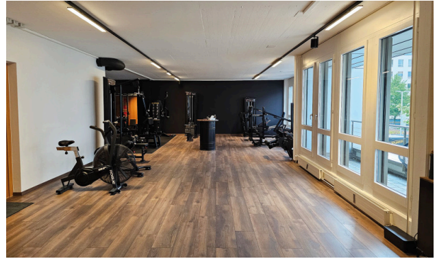
Bestehender Innenausbau kann vom Vormieter übernommen werden