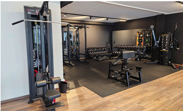
Bestehender Innenausbau kann vom Vormieter übernommen werden