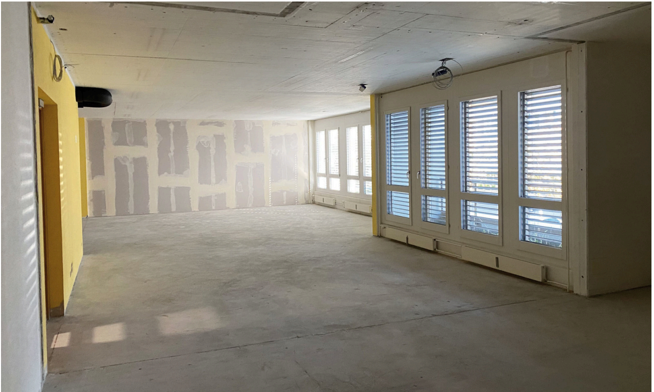
Mietfläche im Grundausbau