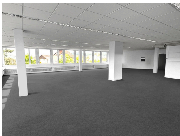
Bürobereich Richtung Eingang