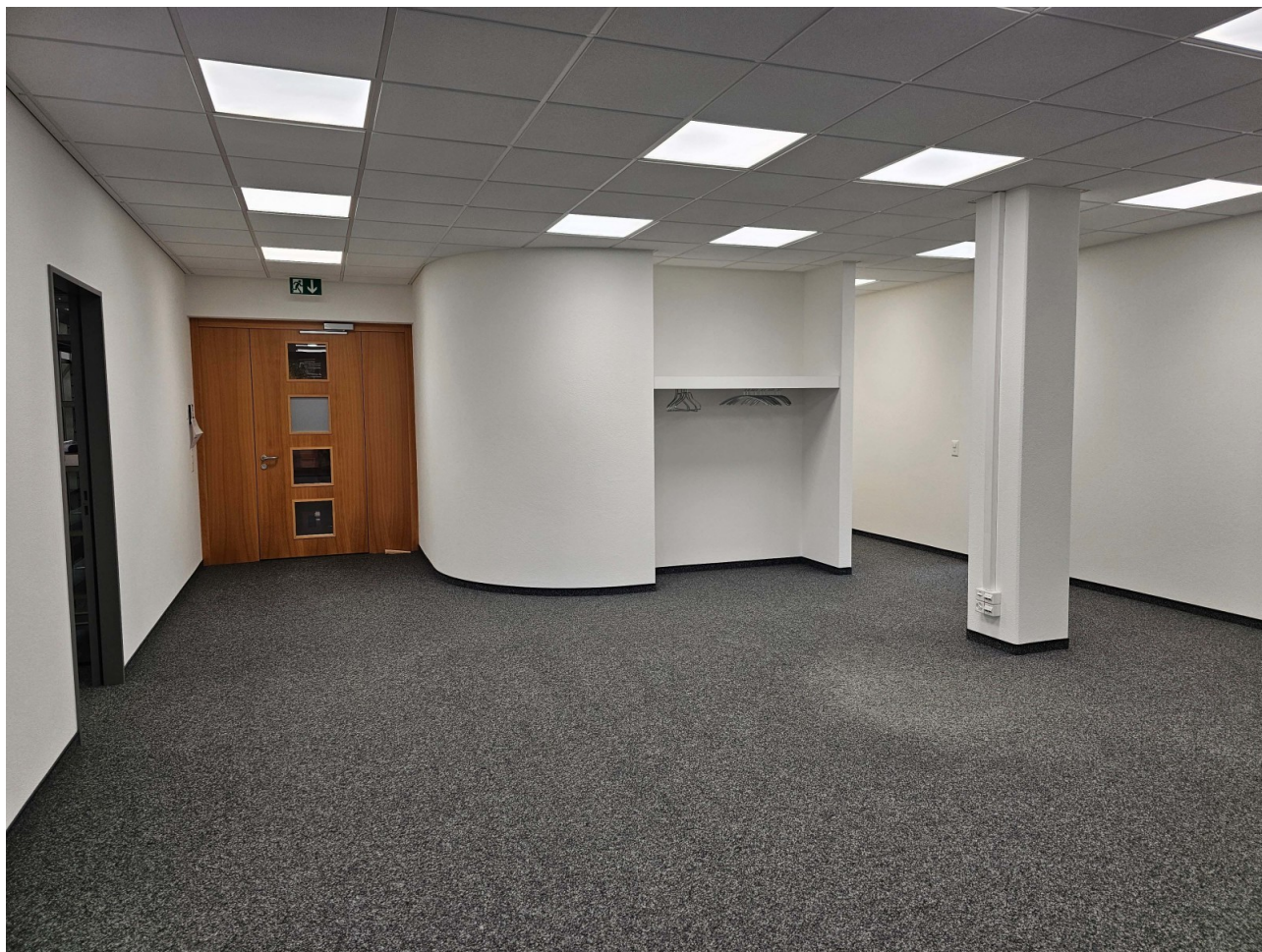
Eingangsbereich mit Garderobe