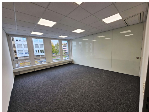
Büro oder Sitzungszimmer mit mobiler Glastrennwand