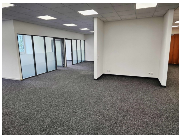
Korridor mit Kopier-Nische