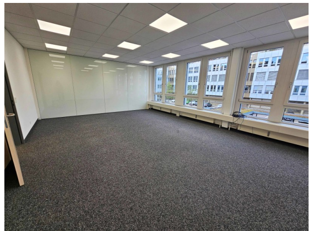
Sitzungszimmer oder Büro mit mobiler Glastrennwand