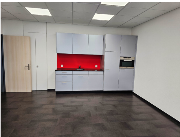
Aufenthaltsraum mit Teeküche