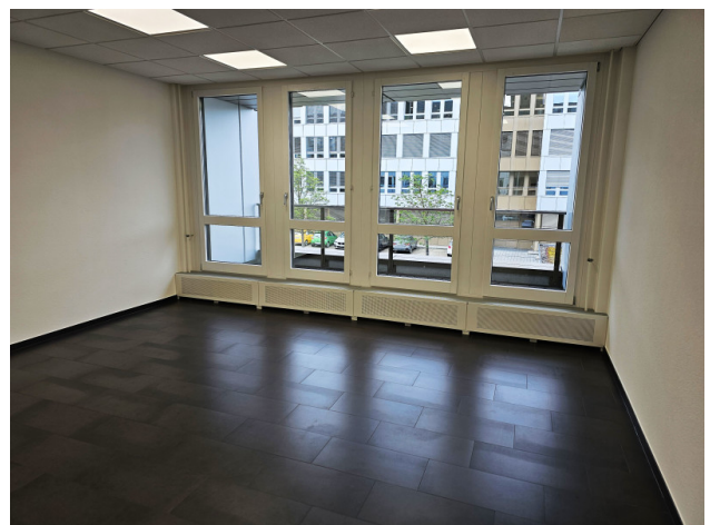
Aufenthaltsraum mit privater Loggia