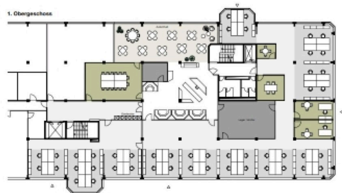
Sennweidstrasse 47/49 Grundrisse 1.OG + 2.OG Nutzungsstudie