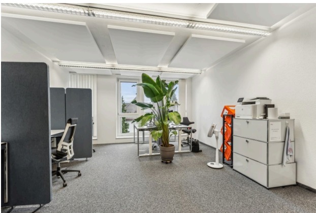
Innenansicht Idealbüro Beispielbild