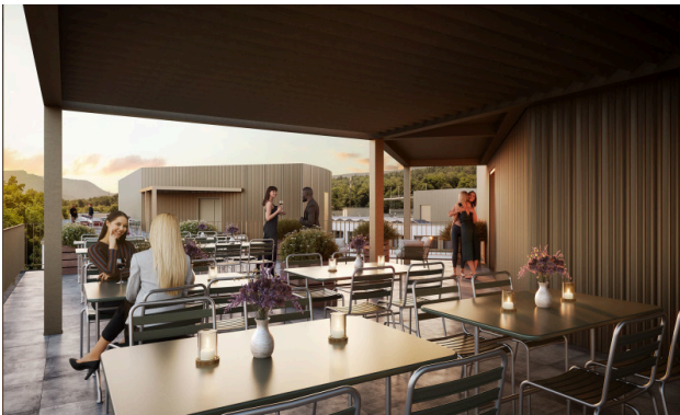
Moments après le travail – l'apéritif parfait au-dessus des toits de la ville