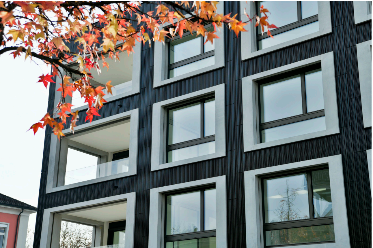
Fassadenansicht Wohn- und Geschäftshaus Marktgasse, Baar