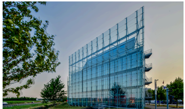
Aussenansicht Richtung Bern