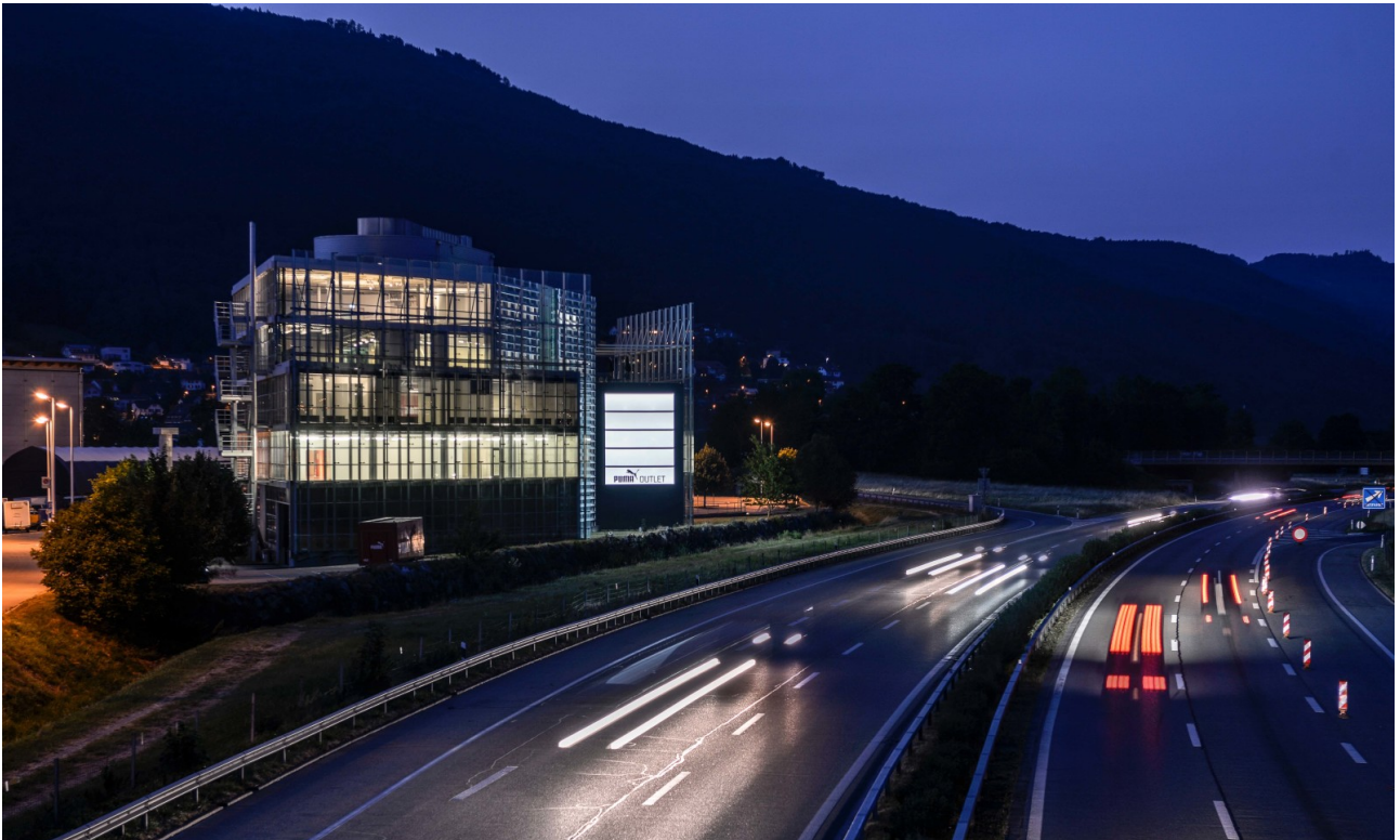
Beleuchtete Werbeträger - gute Sichtbarkeit