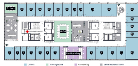
Übersichtsplan - 26 Offices / 2 Meetingräume / 12 Co-Working Arbeitsplätze / ästhetische Gemeinschaftsräume